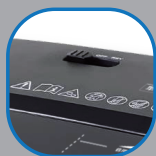
碎紙及退紙切換功能